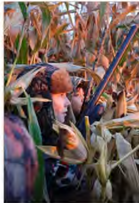
La journée de chasse pour les jeunes

L'équipe de la Conservation de la Nation Sud est composée non seulement d'ingénieurs, d'experts-forestiers, de planificateurs et de biologistes, mais elle compte aussi des spécialistes en éducation, communication et en administration. Nous continuerons de partager notre savoir-faire et de travailler étroitement avec les gouvernements aux niveaux municipal, provincial et fédéral, ainsi que les propriétaires fonciers, les groupes communautaires et nos bénévoles. En travaillant ensemble, nous pouvons garantir que toutes les communautés du bassin hydrographique de la Nation Sud sont des endroits sains et écologiques où il fait bon vivre et travailler.