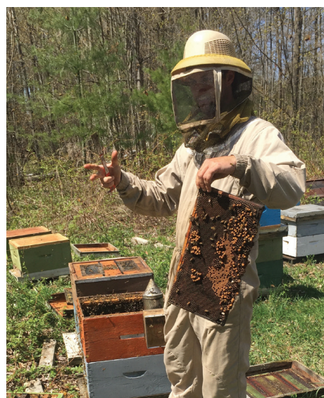
L'apiculture chez Ambrosia Apiaries à Berwick

30 acres de terres de la CNS sont loués à des agriculteurs locaux.