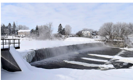
Structure de contrôle de l'eau, rivière Nation Sud à Chrysler

Les responsables de la CNS effectuent également des inspections septiques pour des municipalités. En 2017, la ville de Cornwall a également élargi le mandat de la CNS, permettant la livraison de la partie 8 du Code de l'Ontario (fosses septiques) en son nom, devenant ainsi la 13e municipalité associée à ce programme. En 2017, plus de 370 permis septiques ont été délivrés aux résidents du territoire.