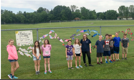
Programme éducatif Stream of Dreams à l'école publique Nationview de South Mountain