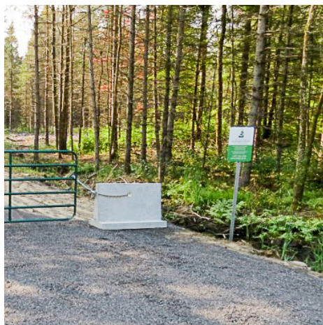
Panneau identifiant une propriété de la CNS à South Dundas