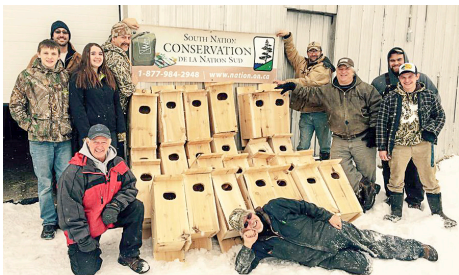
Delta Waterfowl, récipiendaire de la subvention communautaire pour l'environnement de 2017

En 2017, l'équipe chargée de la protection des sources de la région Raisin - Nation Sud a géré 702 menaces portant sur l'eau potable de 210 propriétés, et a travaillé avec les propriétaires fonciers pour élaborer 94 plans visant l'atténuation des risques en matière des sources d'eau potable.