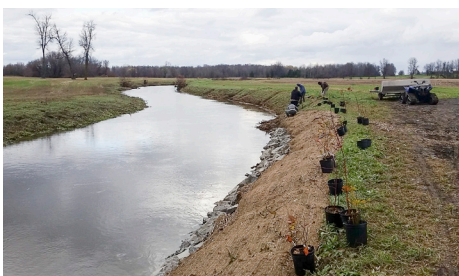
Restauration de l'habitat, rivière South Castor à Ottawa

En 2017, plus de 6 000 $ ont été décernés pour appuyer des tournois de pêche, des festivals, des activités agricoles, des excursions en canoë ou kayak, ainsi que des activités patrimoniales.