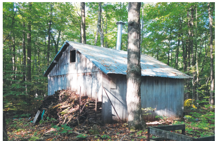
Forêt Oschmann à Ormond