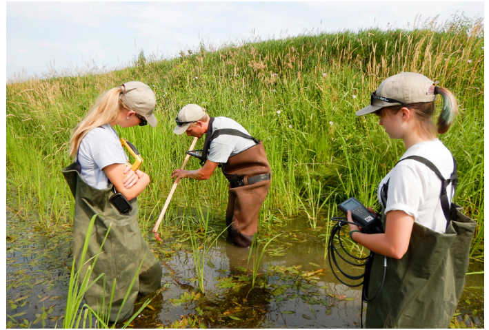
Surveillance du bassin versant menée par le personnel d'intendance et les étudiants d'été de la CNS