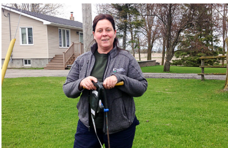
Inspection septique de la CNS

En 2017, nos efforts de surveillance ont guidé 5 projets de restauration visant l'amélioration de la qualité de l'eau, le débit des cours d'eau, l'érosion, la protection des personnes et des biens et l'amélioration des écosystèmes, notamment le ruisseau Shield et la rivière South Castor.