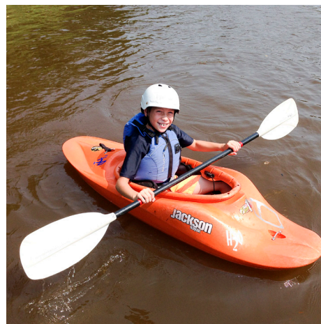
Kayak à l'aire de conservation du pont Cass à Winchester