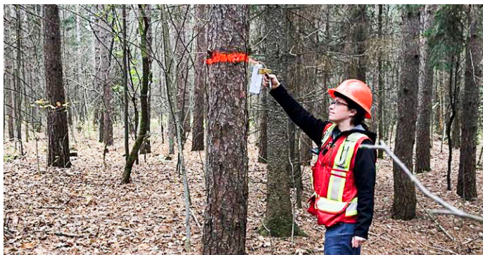
Marquage des arbres par les techniciens forestiers de la CNS dans l'aire de conservation de la forêt Warwick à Berwick